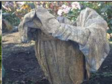
Заготовка лозы и изготовление корзин